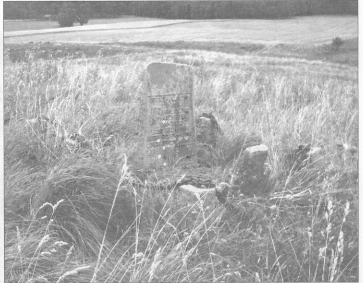
Minnesten rest där Lena gamla kyrka låg, med texten. Detta är helig mark här har Lena gamla kyrka uppförd under 1300-talet legat till år 1935där om vill denna sten rest 1958 minna.

kan nämnas att "den 4 mars 1706 begrov Komminister Hr Jonas Riddelius 8 st lik på en gång alla döda av kopporna".